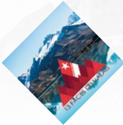
13 faces du Valais

L'équipe de tournage a également une solide expérience du documentaire alpin, avec des collaborations sur :