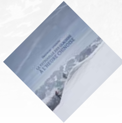
La patrouille des glaciers à l'heure chinoise (TAG HEUER)