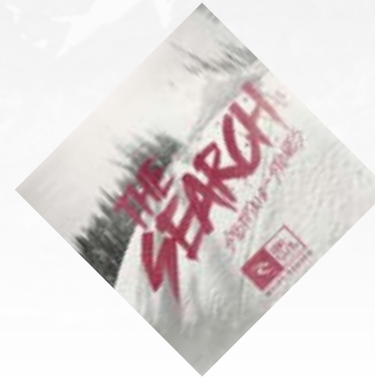
The Search - Stepping stones (RIP CURL)